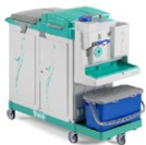
Magic System 840E