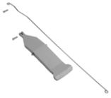
Kit pedal para soporte de bolsa Magic