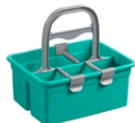
Bandeja portafrascos con empuñadura ergonómica y 3 separadores extraíbles