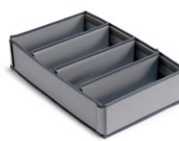
Separador Magic Hotel