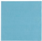
Chiffonnette Profi - T