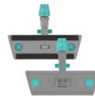
Telaio Velook con Block System