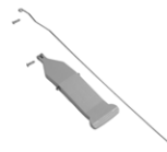
Kit pedale per portasacco Magic